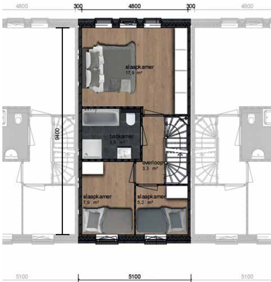
Eerste verdieping Bouwnummers 2 en 5 gespiegeld