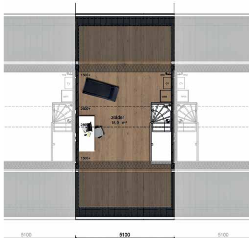
Tweede verdieping Bouwnummers 2 en 5 gespiegeld